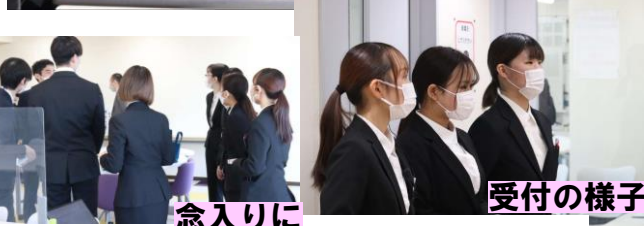
念入りに相談して準備OK！