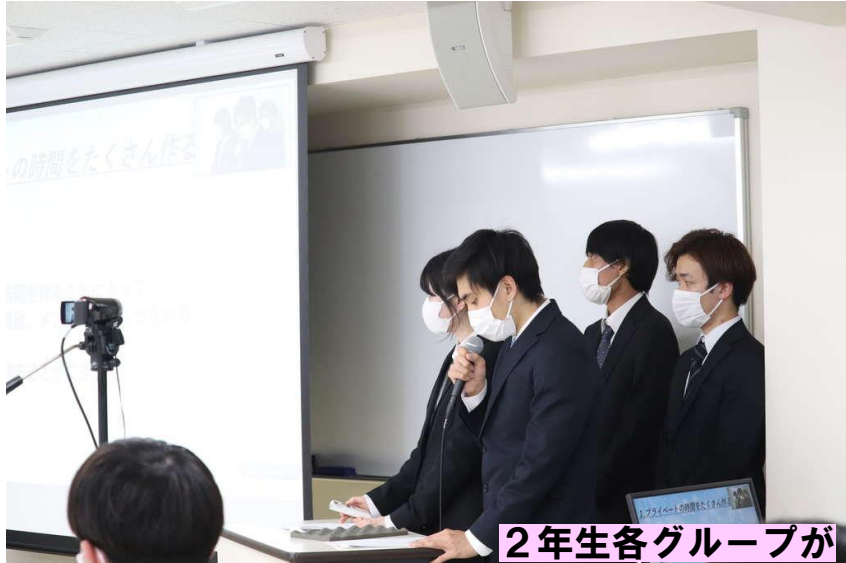
2年生各グループが研究成果を発表！