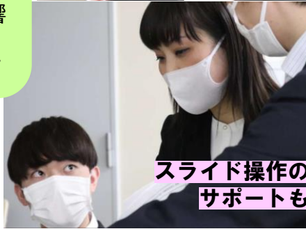
スライド操作のサポートも