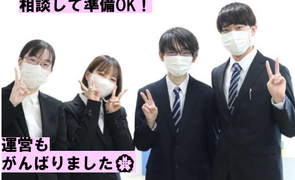
運営もがんばりました☆

IT医療事務総合学科1年生は、4学期目に含まれる「卒業研究」科目で、2年生の発表会にむけた事前準備から当日運営までを企画立案。